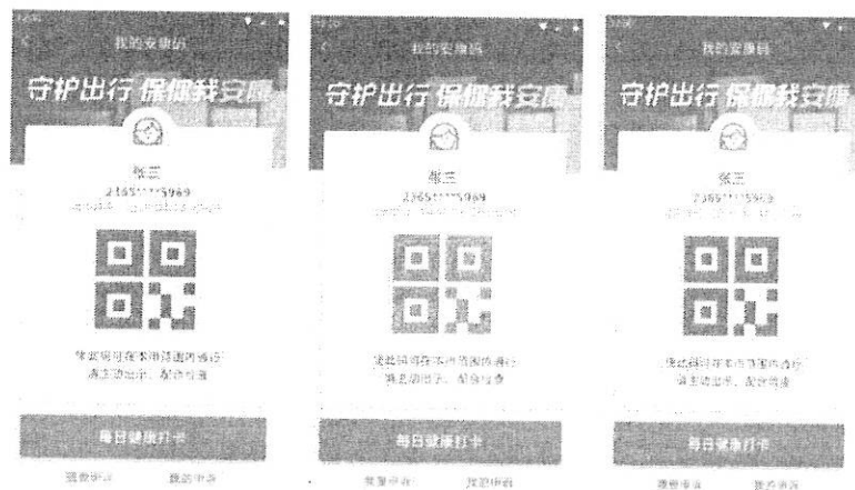
我的“安康码”界面图